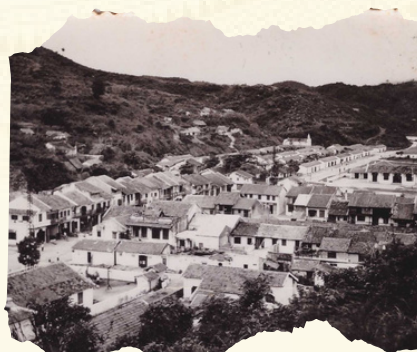
Khu vực trung tâm thị trấn Cẩm Phả năm 1950.

Ngày 19/7/1949, Liên bộ Nội vụ - Quốc phòng ra Nghị định số 142-NV-3 "Đặc khu Hòn Gai thành một đơn vị kháng chiến hành chính riêng thuộc Liên khu I".