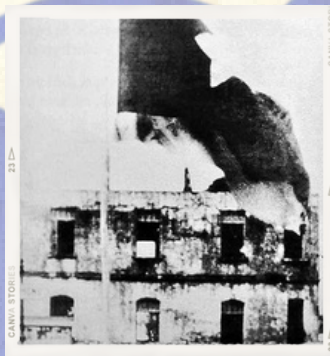
Lá cờ đỏ sao vàng tung bay tại tỉnh lỵ Quảng Yên sau ngày giải phóng 20/7/1945.