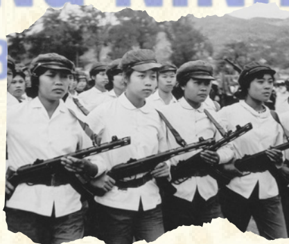
Tự vệ Nhà máy Cơ khí Hòn Gai diễu hành trong thời chống chiến tranh phá hoại của giặc Mỹ.

Tháng 3/1947, Bộ Nội vụ ra nghị quyết sáp nhập Khu đặc biệt Hòn Gai và tỉnh Quảng Yên thành liên tỉnh Quảng Hồng.