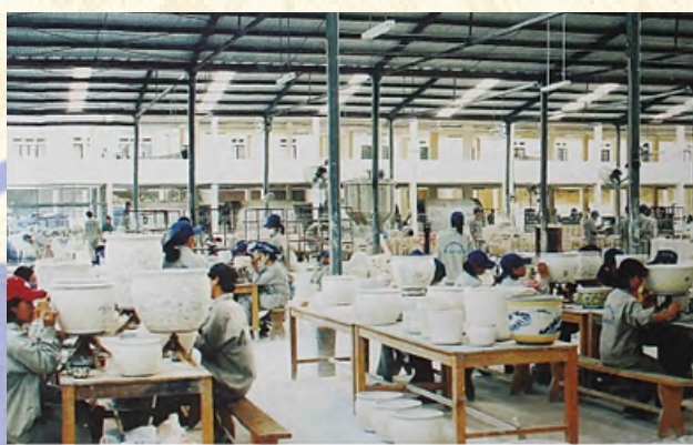
Sản xuất gấm sứ xuất khẩu