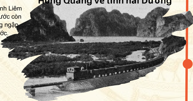
Cầu Kênh Liêm ngày trước còn là vùng ngập nước.

Ngày 28/01/1959, Chủ tịch nước ra Sắc lệnh số 005-SL trả huyện Đông Triều thuộc khu Hồng Quảng về tỉnh Hải Dương