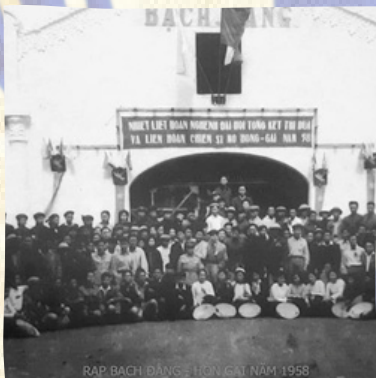
Rạp Bạch Đằng năm 1958.

Lần thứ hai Bác Hồ về thăm Quảng Ninh vào ngày 4/10/1957. Nhân dân thị xã Hồng Gai (nay là thành phố Hạ Long) họp mít tinh mừng đón Bác. Ảnh tư liệu