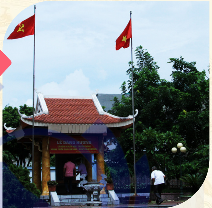
Di tích nhà bia lưu niệm nơi thành lập Chi bộ Đảng đầu tiên ở Mạo Khê nằm trong một không gian yên bình thuộc phường Mạo Khê (TX Đông Triều).