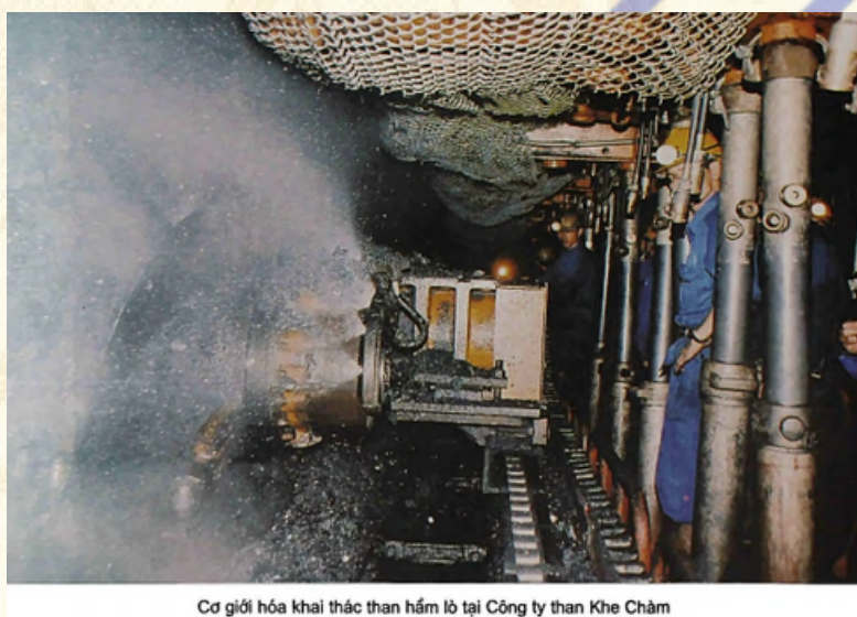
Cơ giới hóa khai thác than hầm lò tại Công ty than Khe Chàm