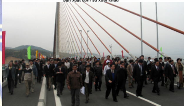
Cầu Bãi Cháy trong ngày khánh thành, 2-12-2006.